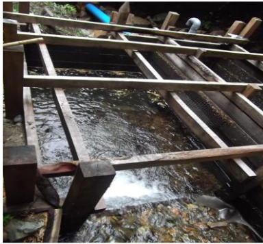
AAVC El Sonia Vecino