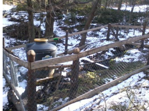
AAVC Dos Lagunas II