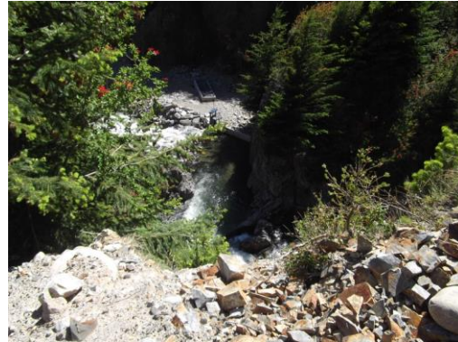
AAVC El Sonia Comunidad