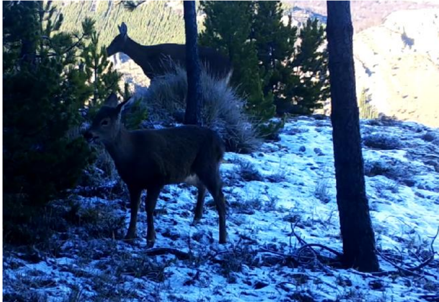
Fotografía de huemul hembra y cría de la temporada