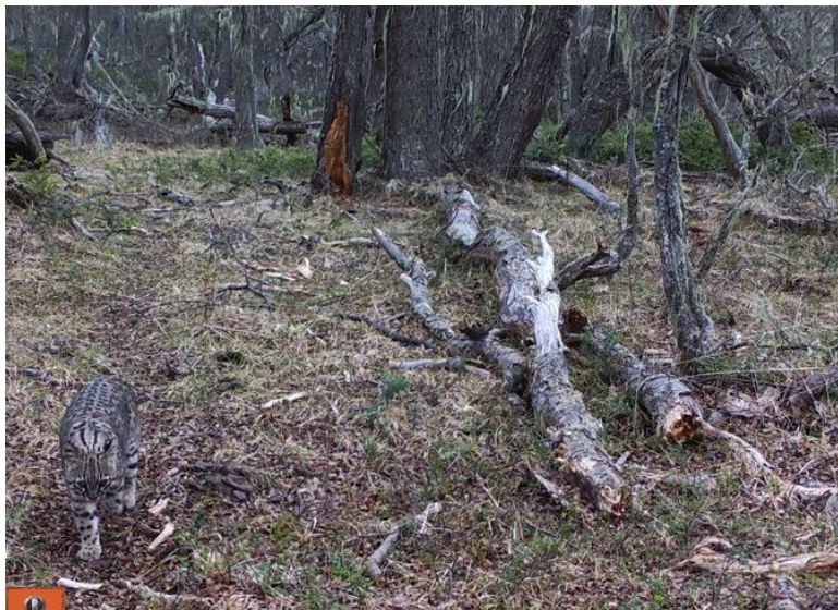
Fotografía de Gato Geoffroy